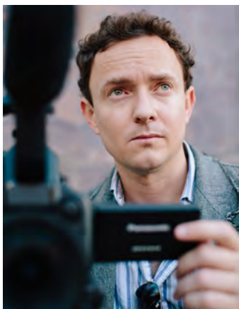
Ο σκηνοθέτης Κάλεν Χόμπακ (Cullen Hoback).