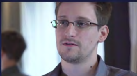
Edward Snowden Whistleblower - NSA PRISM Program June 9th, 2013

Περισσότερες πληροφορίες σχετικά με πρακτικές διαχείρισης δεδομένων που οδηγούν σε διακρίσεις: www.talkingpointsmemo.com/cafe/big-data-is-a-civil-rights-issue www.prospect.org/article/how-big-data-could-undo-our-civil-rights-laws www.weeklywonk.newamerica.net/articles/decoding-discrimination-digital-age